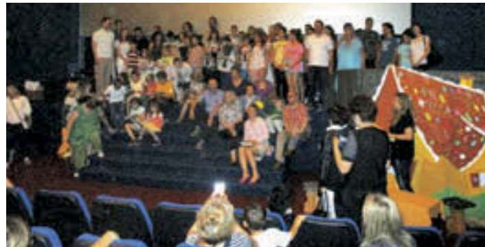
Za konec je sledila spominska fotografija.