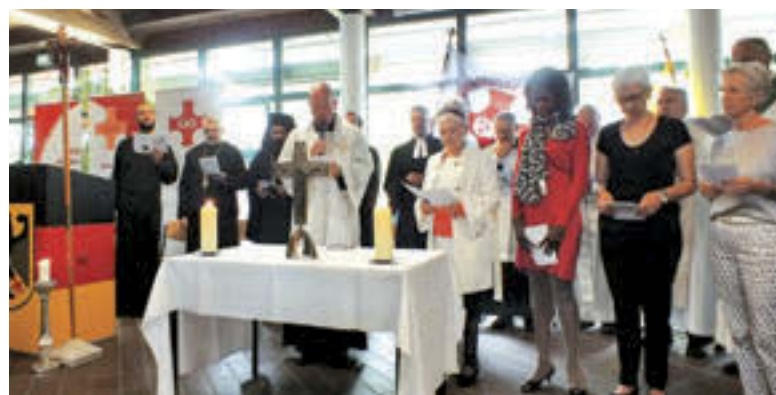
Ekumenska molitev za mir v vojašnici Bergmann-Kasserne v Münchnu

je duhovniško poslanstvo je opravljal na nemški župniji. Hvaležnost teh faranov smo lahko videli na dan biserne maše, ki jo je slavljenec praznoval skupaj s petimi slovenskimi sobraty in krajevnim župnikom na svojem domu. Prišli so tudi slovenski verniki iz skupnosti, kjer je deloval.