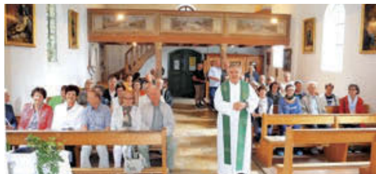
Duhovnik je končal mašno daritev.