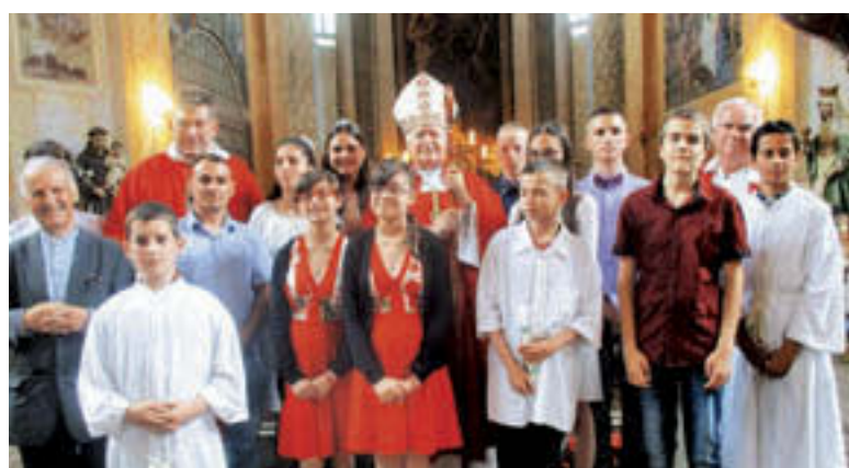
Skupinska slika pred daritvenim oltarjem z birmanci in ministranti