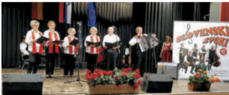
Nastop domače skupine na 40-letnici društva Planinka

pno življenje. Maša v naravi je ena od mnogih priložnosti, da drug drugega z dobro besedo in pozornostjo duhovno obogatimo.« Ko je bilo maše konec, je sledilo okrepčilo v bližnjem mestu Roggenburg v gostišču Alte Roggen-schenke. Z lepimi vtisi in doživetji se je vsak ob koncu nedeljskega srečanja zadovoljen in vesel vrnil domov. R. K.