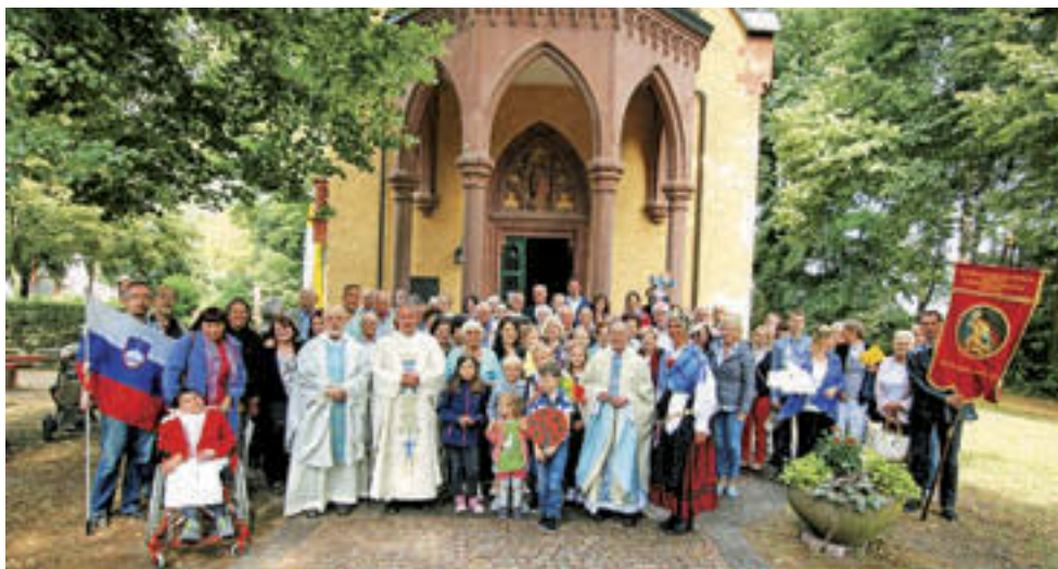
Po zaključku pa še skupinska slika pred cerkvijo