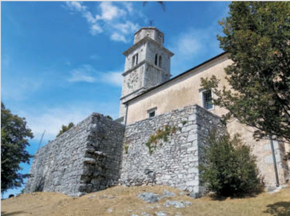
Repentabor, foto: Rafaelova družba