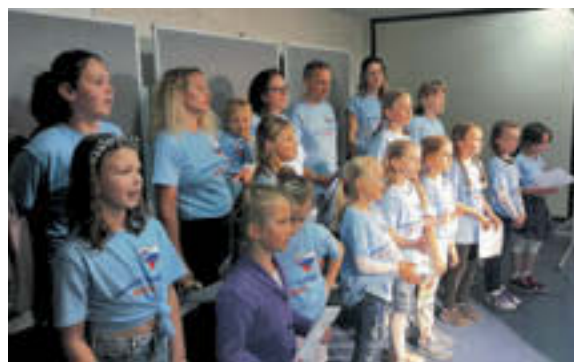
Otroci župnijske šole in starši med nastopom

»Ne bojte se!« (Mt 20,26.28.31). In ravno služenje drugemu nas osvobaja strahu. Kakor sol ohranja hrano pred pokvarljivostjo in propadom, tako ljudje, ki služijo drugim in se jim dajo na voljo, varujejo družbo pred pokvarjenostjo in propadom. Taki ljudje družbo »držijo pokoncji«. Gorje družbi, kjer ne bi bil nihče pripravljen služiti. Svet nujno potrebuje ljudi, katerih dobra dela bodo svetila kakor luč. Hvaležnost je navada srca. Nobeden od nas ni sam vir svojega življenja ali vir vsega tega, kar po-