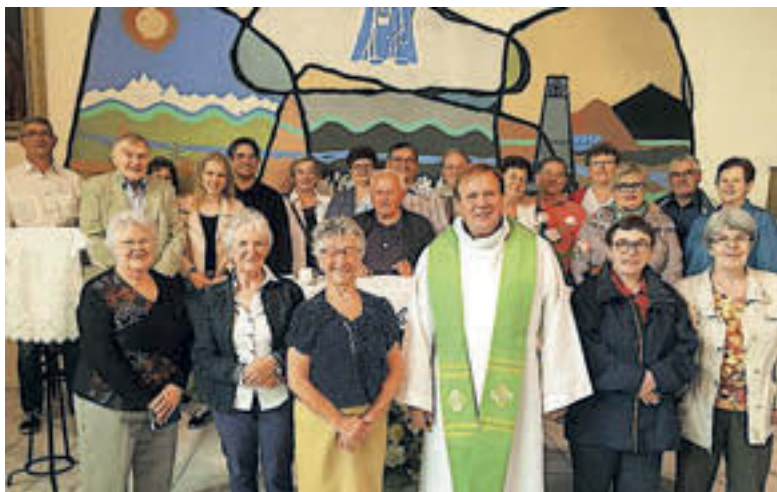
V Méricourtu smo 23. junija imeli še zadnjo slovensko mašo pred počitnicami.