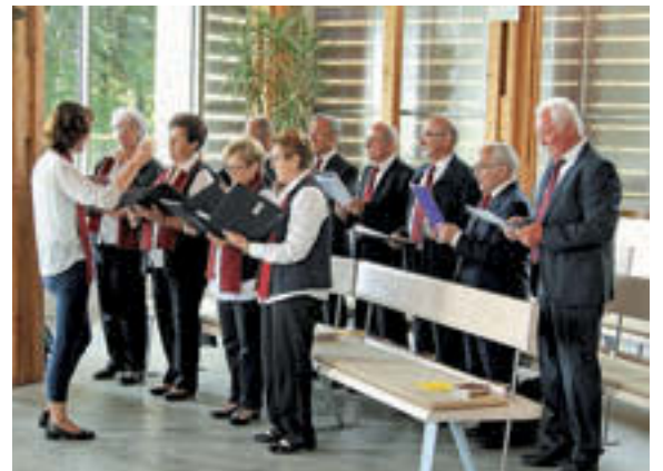
Pevci zbora Obzorje iz Stuttgarta

tudi vodil in imel praznični nagovor. Predvsem nas je spodbujal k narodni zavesti in ljubezni do domovine.