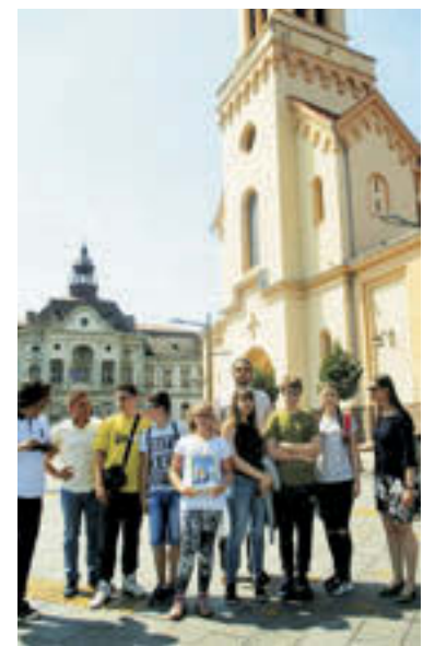
Skupina iz Pančeva pred zrenjaninsko stolnico in mestno hišo