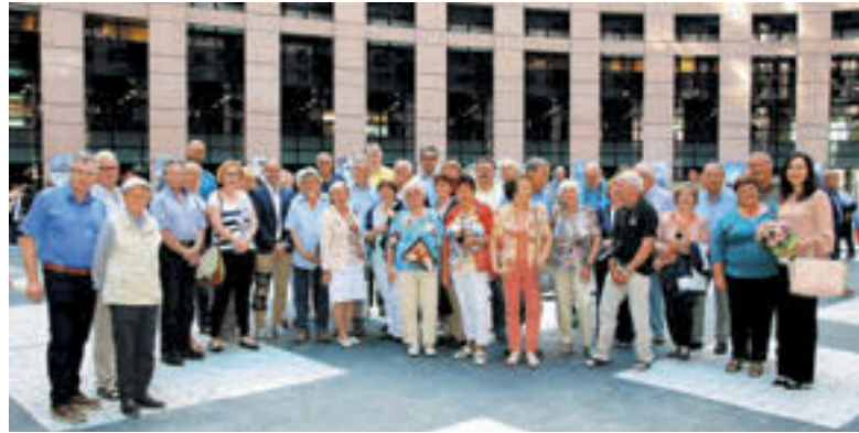
Slovenski zvon iz Krefelda v Evropskem parlamentu v Strassburgu