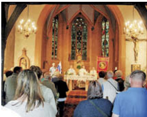
Zaključek romanja v cerkvi v Maria Einsiedel