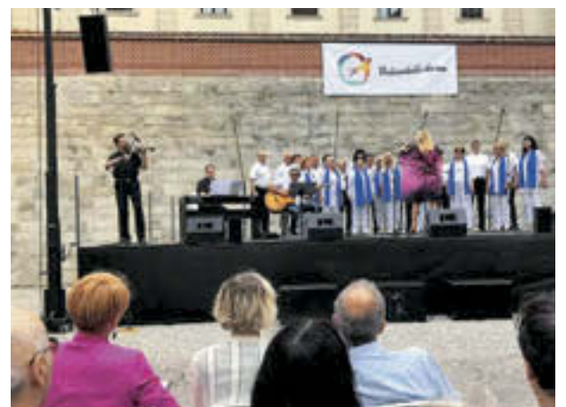
Otvoritev prireditve Dobrodošli doma z nastopom Encijana