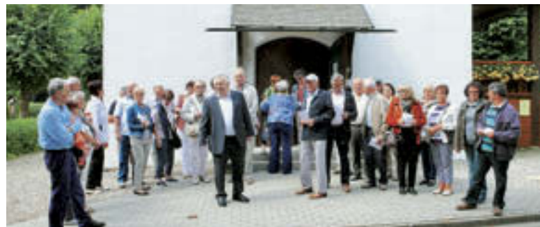
Zbiranje pred cerkvijo Marija Hilf

Lepa sončna nedelja, 24. junija, je bila za slovenske rojake v Augsburgu, Kemptnu, Ulmu in Ravensburgu priložnost, da se srečajo pri »maši v naravi«. V romarsko cerkev, posvečeno Mariji Pomagaj (Maria Hilf), blizu Roggenburga, je vabil domači slovenski župnik že dalj časa in nato v njej na omenjeno nedeljo maševal. Nekateri so se vabilu odzvali in prišli z vseh strani. Maša je dobila praznično podobo po zaslugi sodelovanja vernikov z branjem Božje