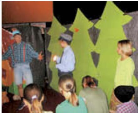
Pavliha se v igrici obrača k otrokom.